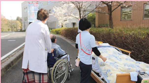
ちょっと肌寒かったです