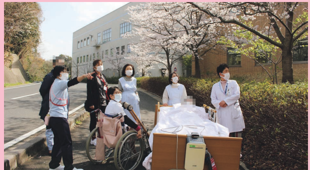
みんなで一緒にお花見しました