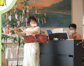
中右先生と西音楽療法士の演奏