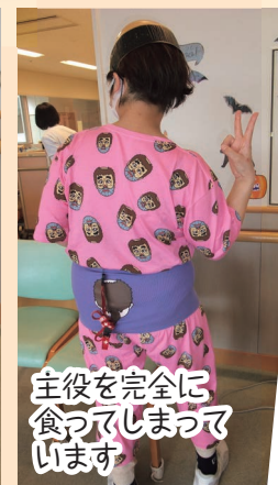
主役を完全に 食ってしまっ ています