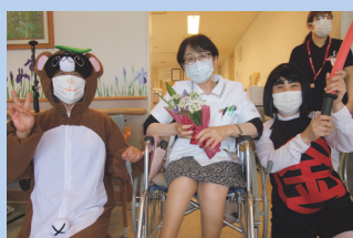
存在感で金太郎の圧勝ですね