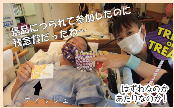
景品につられて参加したのに 残念賞だったわ~