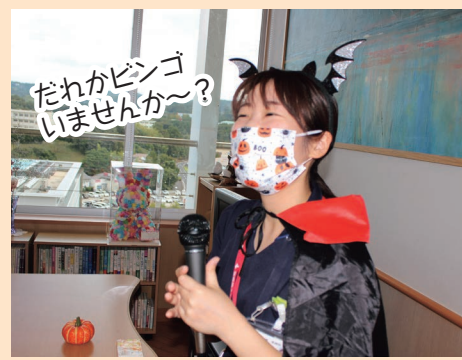
だれかビンゴ いませんか?~?