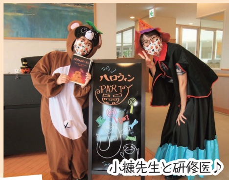
小糠先生と研修医♪