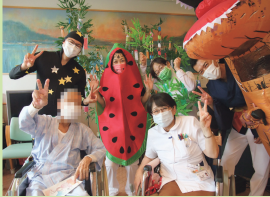
ティラノが切れてますが、患者さんとピースです