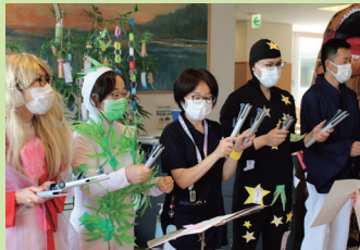
みんなでトーンチャイム演奏