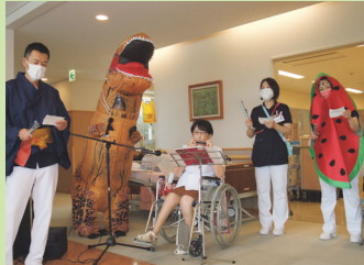
ティラノサウルスがいますけど?!