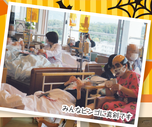
みんなビンゴに真剣です