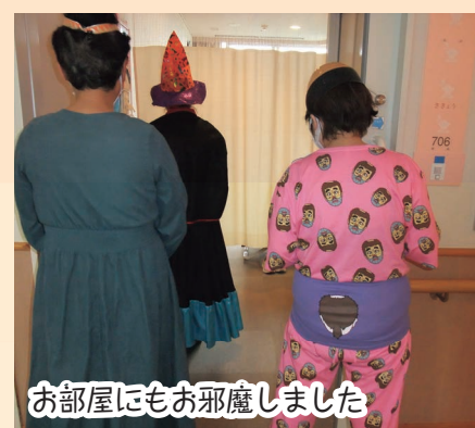
お部屋にもお邪魔しました