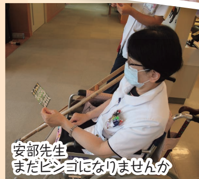
安部先生 まだビンゴになりませんか