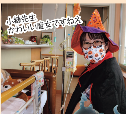
小糠先生 かわいい魔女ですわね