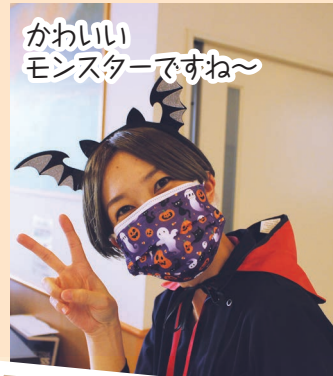
かわいい モンスターですね～