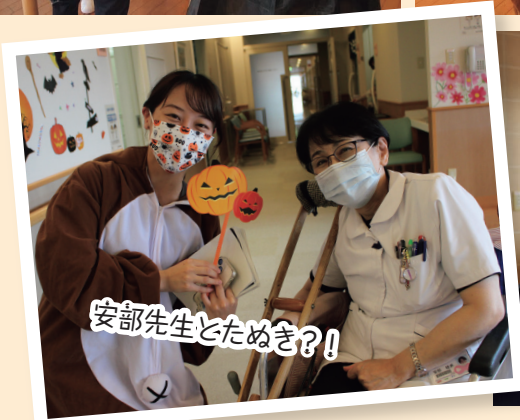
安部先生とためき？！