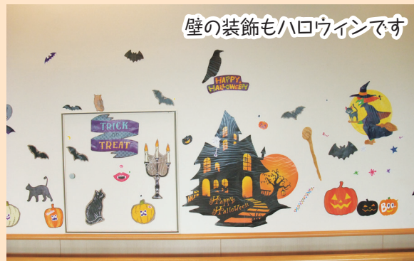
壁の装飾もハロウィンです