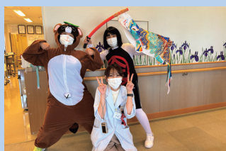
いつもカメラ撮影ありがとうございます！