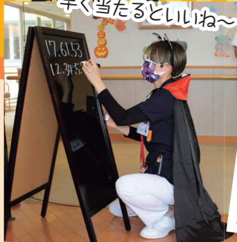
みんな早く当たるといいね~