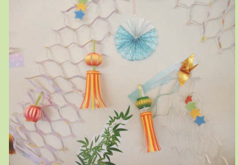
ボランティアさんが作ってくれた飾りもかわいいです