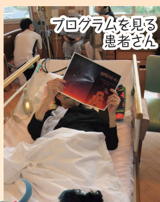
プログラムを見る 患者さん