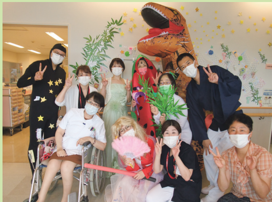
皆さん楽しんでいただけましたか?