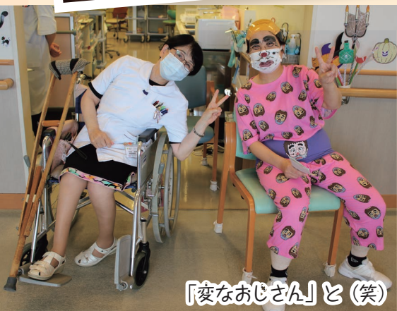
「変なおじさん」と(笑)