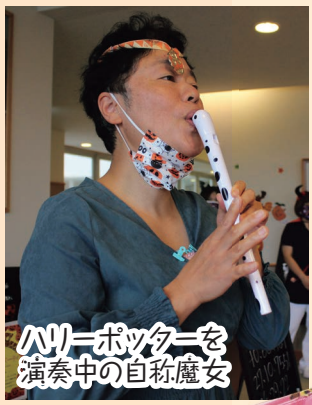
ハリーポッターを 演奏中の自称魔女