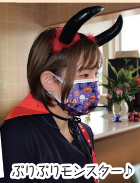
ぶりぶりモンスター♪