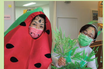
ちなみに「スイカ」と「笹」です