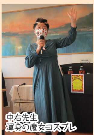
中右先生 渾身の魔女ヨスブレ