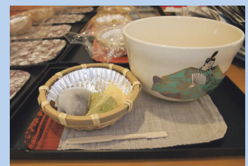
おやつもおいしそうです