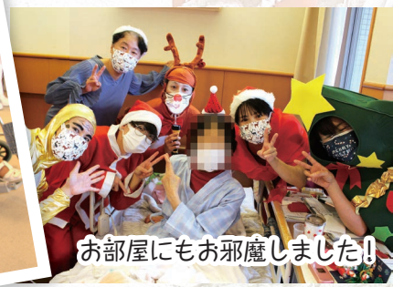
お部屋にもお邪魔しました！