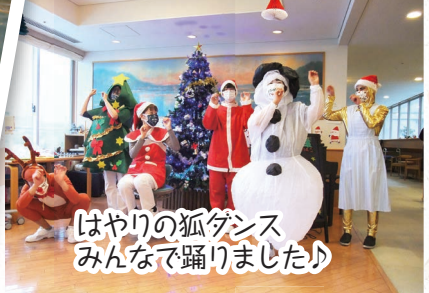
はやりの狐ダンス みんなで踊りました！