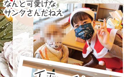
なんと可愛げなサンタさんだねえ