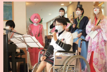
安部先生も歌います！