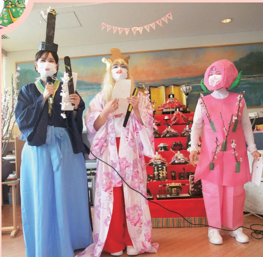
ハンサムなお内裏様とかわいらしいお雛様と…桃？