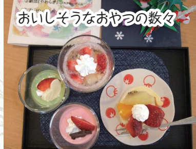
おいしそうなおやつの数々