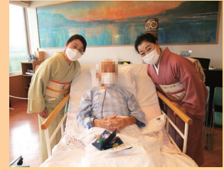
着物の先生方と一緒に♪