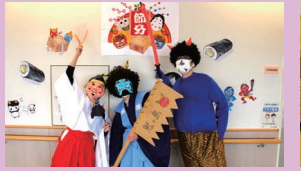
鬼は中右先生です！