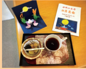
おいしいコーヒーとおいしいお団子♪