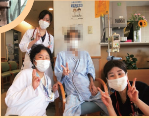
良い演奏を聞かせていただきました！

月見会が行われました。コロナも少しずつ落ち着き、ようやくゲストの方をお招きすることができました。いつもは新春コンサートにお越しいただいているお箏の先生方と尺八の先生を久しぶりにお招きすることができました。