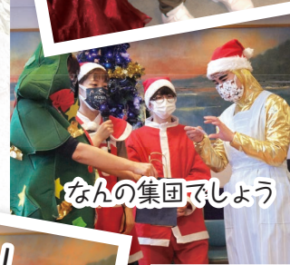
なんの集団でしょう