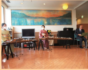
やっぱり箏と尺八の音色は最高ですね