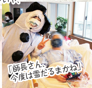
「師長さん、今度は雪だるまかね」