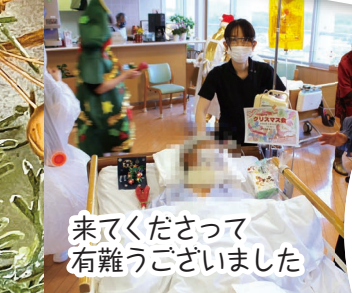
来てくださって有難うございました