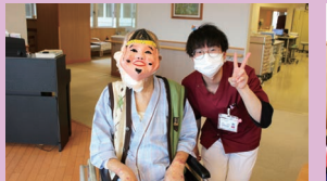
福の神になっていただきました