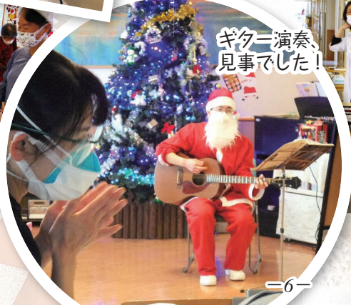
ギター演奏、見事でした！