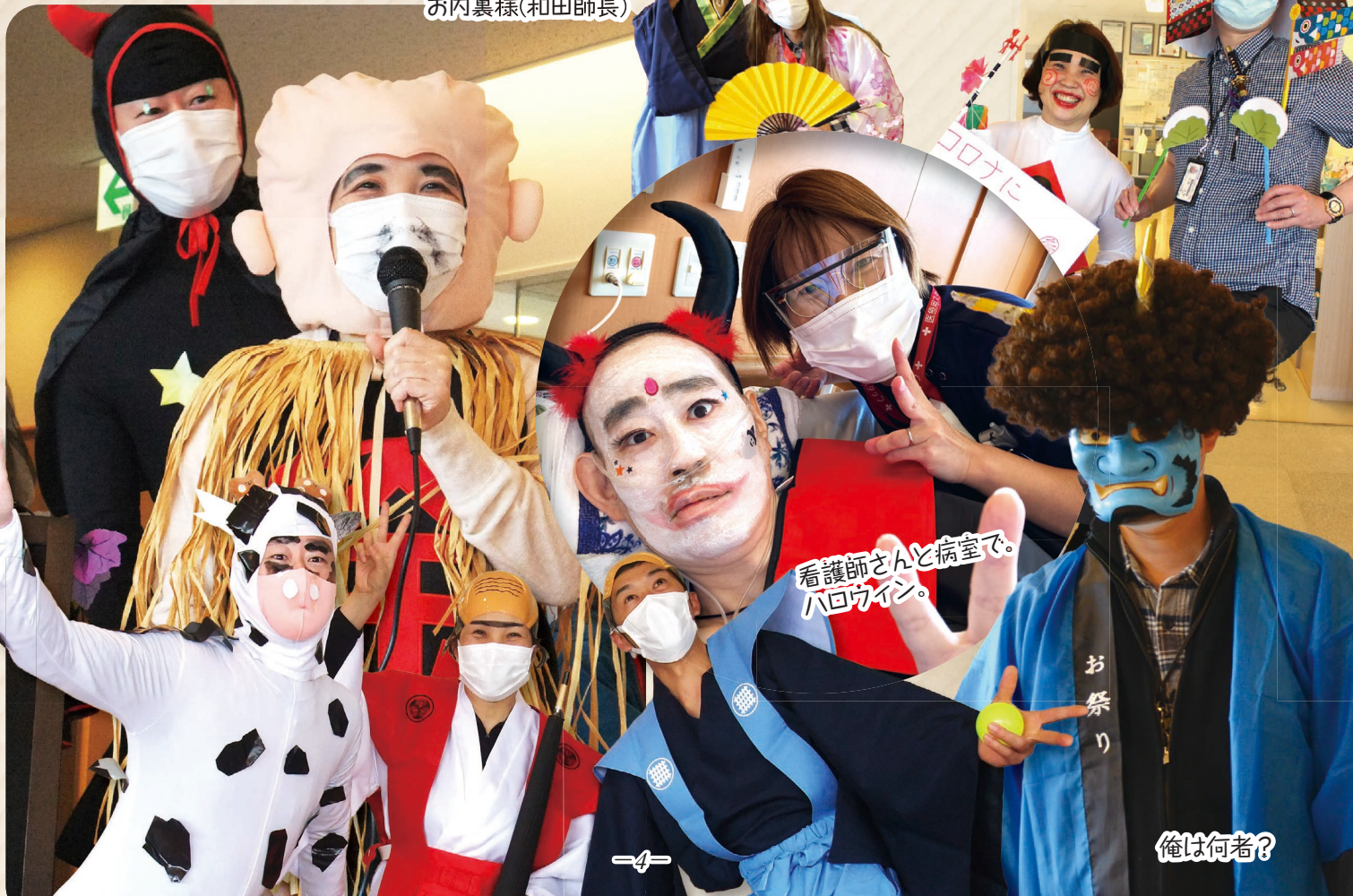
看護師さんと病室で。ハロウィン。