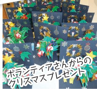
ボランティアさんからのクリスマスプレゼント