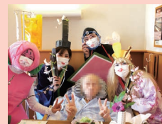
お部屋にも桃の花が届きました