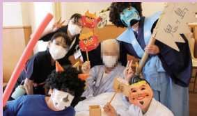
お部屋でも撒いていただきました～