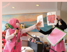
桃がひしもちとひな祭りのうんちくしゃべってます