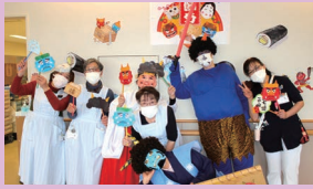
コロナ追い払えたかな！