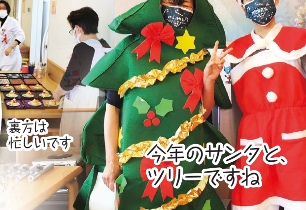
裏方は忙しいです