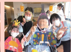
ポップを使って面白く撮りましょ～♪