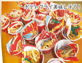
ポテトフライ美味しそう！