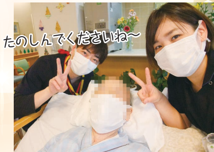
たのしんでくださいね～

令和3年12月16日 クリスマス会を行いました。マスクをしての行事はもう慣れた感じです！逆にマスクを利用してやりたい放題？！スタッフはもちろん、皆さんも楽しんで頂けたようです。