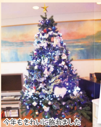
今年もきれいに飾れました