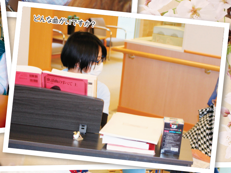
どんな曲がいですか?