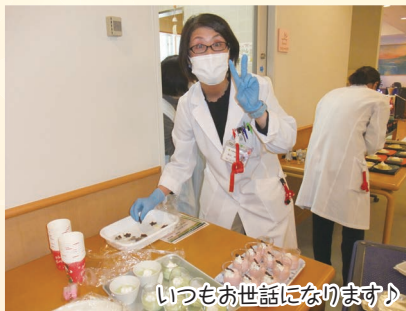
いっつもお世話になります♪