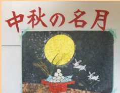
みんなで作成したちぎり絵