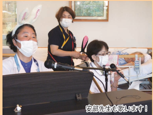
安部先生も歌います！