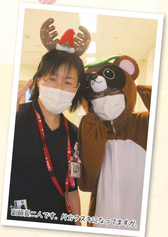
副師長二人です。片方タヌキになってますが。