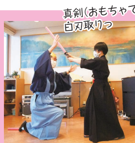
真剣(おもちゃです) 白刃取りっ