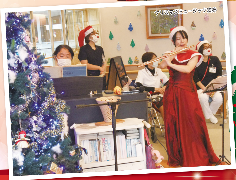
クリスマスミュージック演奏