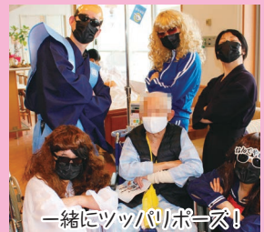
一緒にツッパリポーズ!