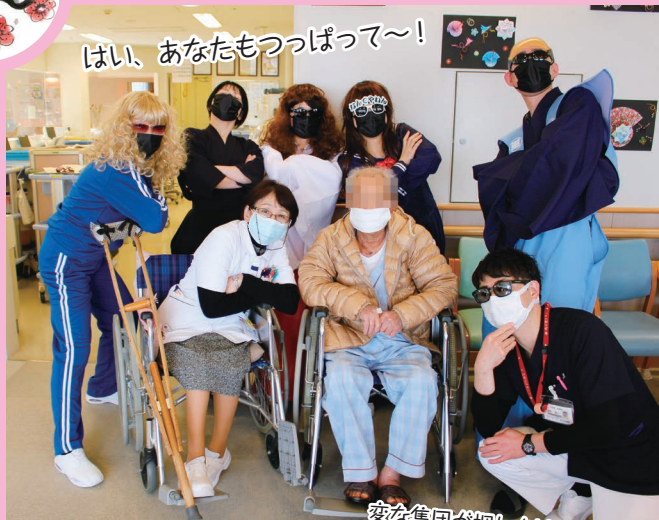
はい、あなたもつっぱって〜!