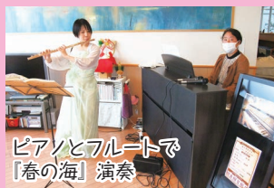
ピアノとフルートで「春の海」演奏