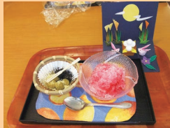
栄養士さん手作りおやつ♪