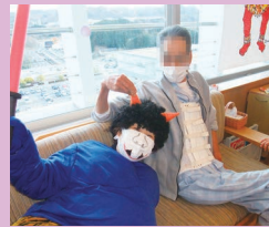
「よくできとるなあ」