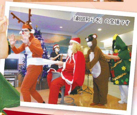
「劇団和らぎ」の登場です