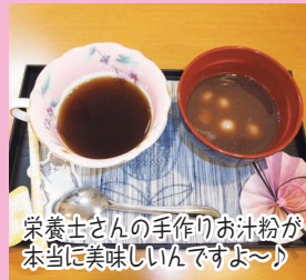
栄養士さんの手作りお汁粉が本当に美味しいんですよ〜!