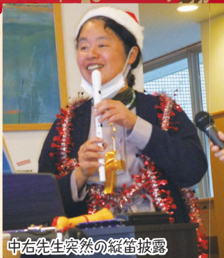
中右先生突然の縦笛披露