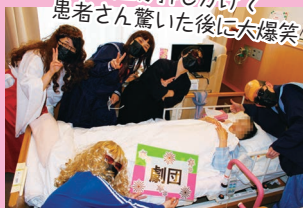
変な集団が押しかけて患者さん驚いた後に大爆笑!