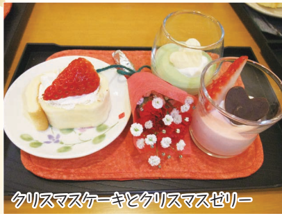
クリスマスケーキとクリスマスゼリー