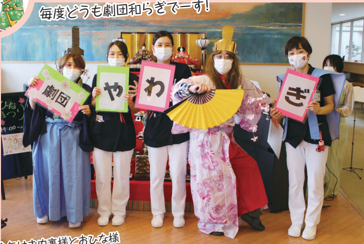
今年はお内裏様とおひな様 逆バージョンで！