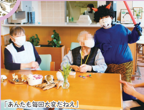
「あんたも毎回大変だねえ」