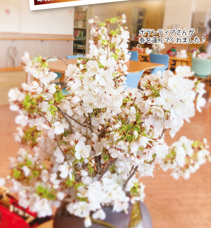
ボランティアさんが春を運んでくれました♪