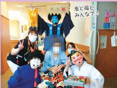
鬼と福と みんなで♪