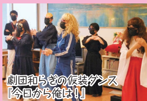
劇団和らぎの仮装ダンス「今日から俺は!!」