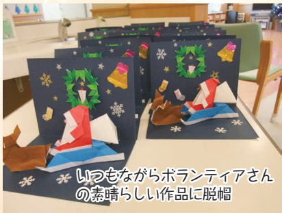
いっつもながらボランティアさんの素晴らしい作品に脱帽