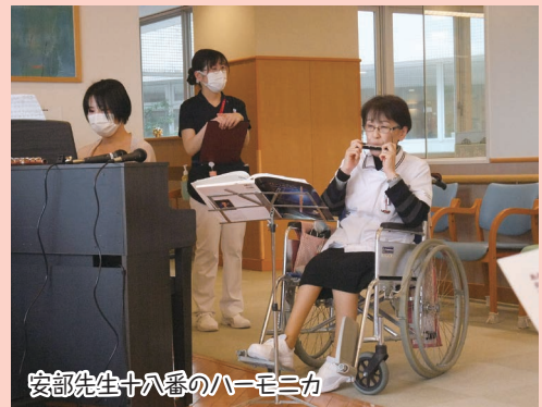
安部先生十八番のハーモニカ