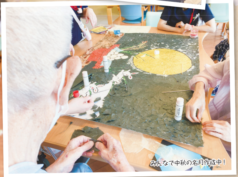
みんなで中秋の名月作成中!