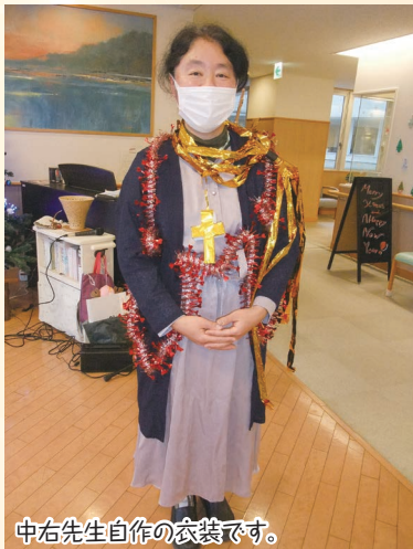
中右先生自作の衣装です。