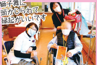
獅子舞に頭がしられて縁起がいいです