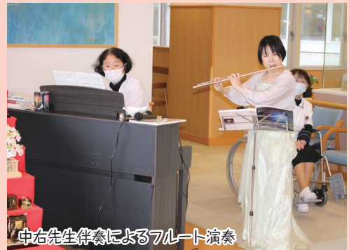
中右先生伴奏によるフルート演奏