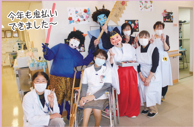
今年も鬼払い できました～