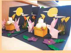
ボランティアさん作成のお月見飾り♪