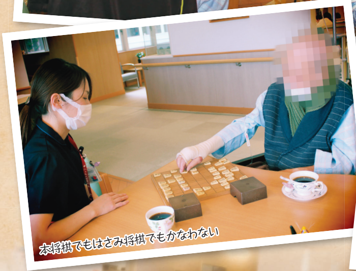
本将棋でもはさみ将棋でもかなわない